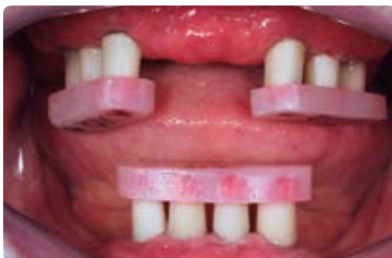
Abb. 26 Eingliederung der Primärteile mit einem im Labor vorgefertigten Übertragungsschlüssel