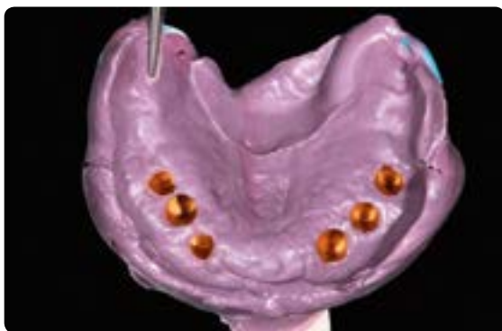
Abb. 28 Überabformung mit verklebtem Gerüst für die Herstellung des Meistermodells