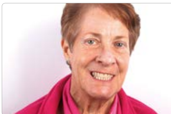
Abb. 32 und 33 Mit diesem Zahnersatz konnte der Patientin Lebensqualität zurückgegeben werden. Vergleicht man das Bild mit der Ausgangssituation, wird deutlich, welche Wirkung ein funktionsgerecht gestalteter Zahnersatz haben kann. Die Patientin fühlt sich sichtlich wohl. Die Doppelkronen gewähren einen festen Halt. Die Prothese ist bei Bedarf einfach umrüstbar, erweiterbar, reparabel und kann lange getragen werden

Haftung zwischen Innen- und Außenkrone bei Galvano-Keramik-Doppelkronen entsteht nicht über die Friktion, sondern über Adhäsionskräfte. Als ein Nachteil von Zirkonoxid-Primärkronen mit Galvano-Sekundärkronen ist eine unter Umständen eingeschränkte Ästhetik zu nennen. Die Sekundärkronen müssen mit einer Tertiärstruktur gefasst sein, um ein Aufbiegen der weichen Goldränder zu vermeiden.