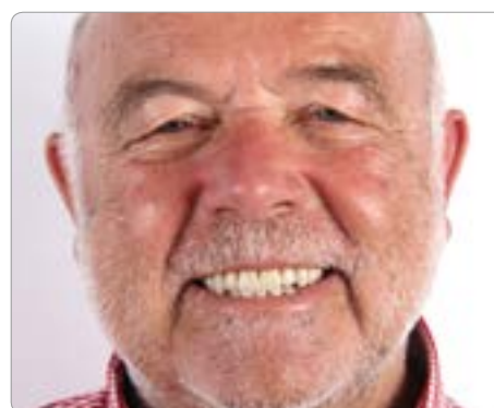
Abb. 4 Das Gerüst musste neu verblendet werden. Es wurden ausschließlich Materialien gewählt, die den hohen Belastungen gerecht werden und Plaque abweisend sind. Ein hoher Aufwand, der mit einer überlegten Materialwahl erspart geblieben wäre (Konfektionszähne Phonares II; Verblendkomposit Nexco SR, beides Ivoclar Vivadent)

die Erfüllung seiner Ansprüche ist. Findet zum Beispiel die Prothese im Unterkiefer keinen Halt oder ist die Abdeckung des Gaumendaches störend, entscheidet er sich eventuell aus leidvoller Erfahrung schnell für Implantate. Aus zahnmedizinischer und zahntechnischer Perspektive wird die Totalprothese als therapeutisches Provisorium dann zu einer Art Blaupause für den zukünftigen Zahnersatz, anhand derer die vertikale und horizontale Dimension, die Funktion sowie die Ästhetik beurteilt werden (Abb. 1 und 2). Zudem bietet die vorhandene Prothese eine Basis für das DVT und die daraus resultierende Bohrschablone. Letztlich ist eine gut gefertigte, funktionell orientierte Totalprothese auch erweiterbar und kann zur einfachen implantatprothetischen Versorgung umgearbeitet werden. Die Totalprothetik ist als Therapieoption also längst nicht obsolet. Aber auch die Materialwahl ist ein wesentlicher Aspekt für eine langzeitstabile Versorgung (Abb. 3