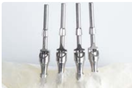
Abb. 20 und 21 Therapieoption: Als günstige teleskopgetragene Lösung kann die Verankerung der Prothese über präfabrizierte Konuskronen (zum Beispiel SynCone-System, Dentsply Implants) erachtet werden. Die präfabrizierten Sekundärteile werden auf die Implantataufbauten aufgesetzt, die Prothese über den Implantaten platziert und die Sekundärteile mit einem Autopolymerisat in der Prothesenbasis verankert

kaum Nacharbeit. Allerdings scheint die Stegherstellung kompromissbehafteter, als noch vor Kurzem angenommen. In einigen Fällen sind Probleme aufgetreten, die uns nachdenklich stimmen. Hierzu gehören zum Beispiel ein kaltverschweißender Effekt von Steg und Reiter, das Auflösen der Riegel, das Auftreten von Bewegungen oder der Verlust von Haltekraft. Das sind zwar Ausnahmesituationen, die jedoch nicht ignoriert werden können. Ein weiterer Nachteil stegretinierter Implantatversorgungen ist zudem die erschwerte Reinigungsfähigkeit. Der Patient muss den Ehrgeiz sowie das notwendige Geschick aufbringen, die Prothese sowie insbesondere den basalen Bereich des Steges tagtäglich zu reinigen. Aus perio-prothetischer Sicht stellen teleskopgetragene Implantatversorgungen eine valide Therapiealternative dar (Abb. 18 und 19).