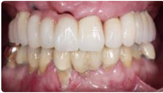
Abb. 5 Dieser Patient wurde vor wenigen Jahren im Ober- sowie Unterkiefer mit implantatgetragenen feststehenden Brücken versorgt. Das Bild ist ein typisches Indiz dafür, dass ein feststehender Zahnersatz bei älteren Menschen nicht immer die optimale Lösung ist. Nach kurzer Tragezeit zeigte sich eine Insuffizienz durch inflammatorisch ausgelösten Hart- und Weichgewebsverlust. Diese Arbeit ist nicht oder nur mit großem Aufwand erweiterbar

In den vergangenen Jahrzehnten haben wir bei der implantatprothetischen Versorgung des zahnlosen oder gering bezahnten Kiefers verschiedene Trends beobachten können: