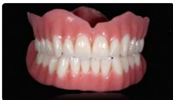
Abb. 8 Wie in unserem Konzept üblich, wurde im ersten Schritt ein therapeutisches Set-up (Totalprothese) erarbeitet. Hierbei standen die Funktion, die Phonetik und die Ästhetik im Fokus