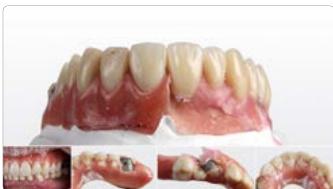
Abb. 3 Diese Doppelkronen-Prothese war zirka zwei Jahre im Mund. Aufgrund der hohen Kaukräfte war die Prothese innerhalb kurzer Zeit zerstört. Die dauerhafte Funktionsfähigkeit eines Zahnersatzes beschränkt sich nicht nur auf die Verankerung; auch die Materialwahl muss gezielt erfolgen. Das obere Bild zeigt im zweiten Quadranten die „alten“ herkömmlichen PMMA-Zähne, die abradert, frakturiert und stark verfärbt waren. Im ersten Quadranten sind die Zähne bereits gegen eine hochwertige Alternative ausgetauscht