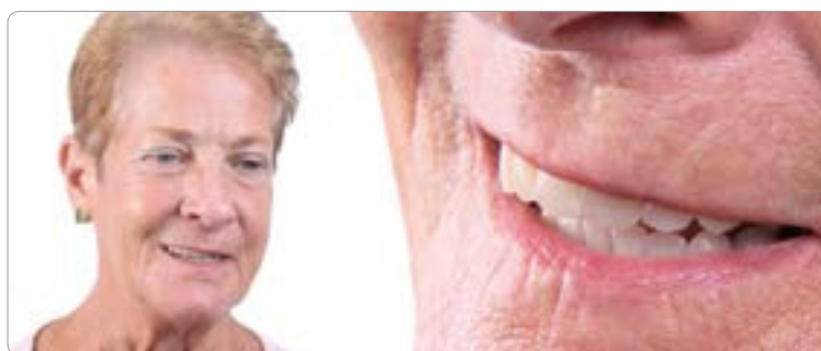
Abb. 9 Bereits mit dem Set-up konnten wir der Patientin Selbstvertrauen und Sicherheit zurückgeben. Es zeigte sich eine deutlich veränderte Physiognomie, die die Patientin jünger wirken ließ und ihr wieder Selbstbewusstsein im Alltag zurückgab. Das therapeutische Set-up diente nun zur Adaptation an den Zahnersatz. Erst dann fällt die Entscheidung nach dem Verankerungskonzept der definitiven Prothesen, wobei Patienten immer verschiedene Optionen angeboten werden sollten

der vor einer Implantattherapie ohnehin einem hohen Stresslevel ausgesetzt ist, kann maximal drei von uns genannte Punkte verarbeiten [Schwartz-Arad D, Bartal Y, Eli I. Effect of stress on information processing in the dental implant surgery setting. Clin Oral Implants Res. 2007 Feb;18(1):9-12]. Bei dem Gespräch geht es uns vielmehr darum, zu erfahren, was dem Patienten wichtig ist, welche Grundbedürfnisse er hat, welche Anforderungen er an den Zahnersatz stellt und welche Bedeutung beispielsweise die Ästhetik spielt. Wie hoch ist der Aufwand, der investiert werden kann und wo liegen Ängste oder Hoffnungen? Basierend auf den gesammelten Informationen kann über eine Wachs-Aufstellung (Mock-up) beziehungsweise das therapeuti-