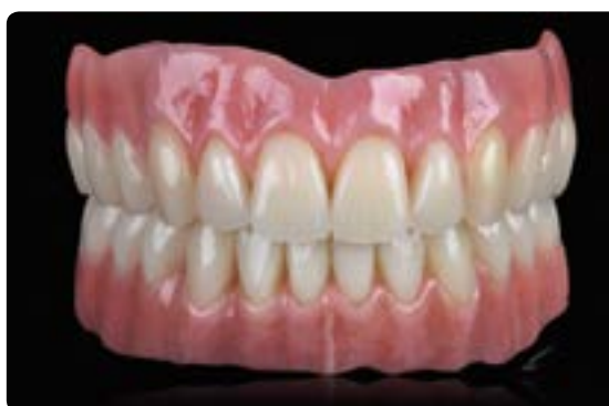
Abb. 31 Die „prothetische Gingiva“ kommt dem gesunden Weichgewebe nahe. Feinheiten in der Textur, wie eine zarte Stippelung, leichte Alveolenhügel oder der Gingivasaum wirken sehr natürlich. Es wurden Konfektionszähne aus einem Nano-Hybrid-Komposit gewählt, die speziell für die hohen Kaukräfte einer implantatprothetischen Versorgung ausgelegt sind