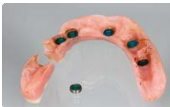
Abb. 13 Als ein Nachteil von locatorverankertem Zahnersatz kann die unter Umständen begrenzte Funktionsfähigkeit erachtet werden. Prothesenbrüche, so wie hier exemplarisch dargestellt, können ebenso auftreten wie der häufige Retentionsverlust. Nachteilig sind die Folgekosten durch Reparaturen, der Austausch der Retentionsteile sowie ein eventuell eingeschränkter Tragekomfort. Wir empfehlen grundsätzlich eine NEM-Struktur einzuarbeiten

auf Implantaten (Locatoren, Stege, Teleskope) (Tab. 1). Lachlinie und Volumen des notwendigen prothetischen Ersatzmaterials (Komposit-Defekt) in vertikaler und horizontaler Dimension sind dabei ultimative Entscheidungskriterien (Abb. 11). Es geht dabei um die Fragen: Wie viel Knochen und Weichgewebe fehlen? Was muss prothetisch ersetzt werden? Handelt es sich um einen reinen Zahnverlust ohne Resorption oder um einen kombinierten Defekt/Komposit-Defekt, also einen Verlust von Hart- und Weichgewebe?