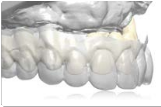
Abb. 14 Digitalisiertes Set-up: Egal welcher Therapieweg gewählt wird, das therapeutische Set-up ist immer die Grundlage. Der digitale Vorwall bildet den „Mantel“ für die Planung der idealen prothetischen Therapieoption