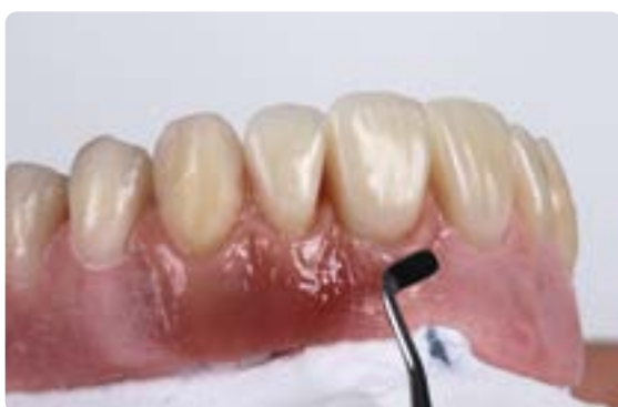
Abb. 30 Für die Fertigstellung wurden Materialien gewählt, die einer dauerhaften Belastung ebenso gerecht werden wie der natürlichen Ästhetik. Das prothetische Weichgewebe wurde individuell mit einem lichthärtenden Laborkomposit verblendet