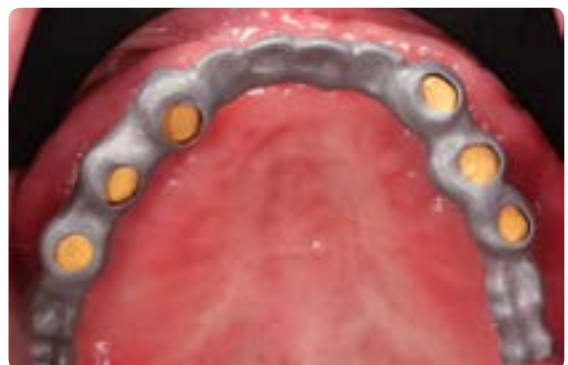
Abb. 27 Intraorale Verklebung der Sekundärkronen mit dem Tertiärgerüst nach dem klassischen Weigl-Protokoll (spannungsfreie Passung)

summe für einen teleskopierenden Zahnersatz nicht signifikant ins Gewicht fallen. Der große Nachteil ist, dass die Vorteile der Doppelkronen-Technik mit anderen Materialien abgeschwächt werden. Die vollkeramischen Primärteile werden mit einer Konizität von zwei Grad erarbeitet und darauf die Sekundärteile aus Feingold galvanisiert. Die Kronen werden über eine edelmetallfreie Tertiärstruktur gefasst. Insbesondere das sanfte