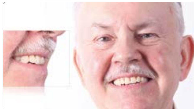
Abb. 2 Mit einem Set-up wurde eine auf seine Bedürfnisse abgestimmte Situation erarbeitet und ein therapeutisches Set-up (Totalprothese) erstellt. Sofort zeigte sich eine natürliche Gesichtsphysiognomie. Der Patient erkannte sich selbst wieder und fühlte sich von Beginn an wohl. Das Set-up galt als Zieldefinition, anhand dessen über die Art der prothetischen Versorgung entschieden wurde