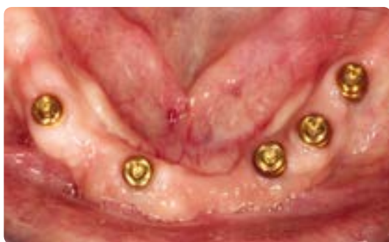
Abb. 12 Therapieoption: Locatoren; die einfachste Verankerungsmöglichkeit für die implantatprothetische Versorgung des zahnlosen Kiefers. Das Locator-Abutment – ein ringförmiger Retentionsanteil und eine transmukosale Manschette – ist aus einer goldfarbenen Titan-Nitrit-Beschichtung