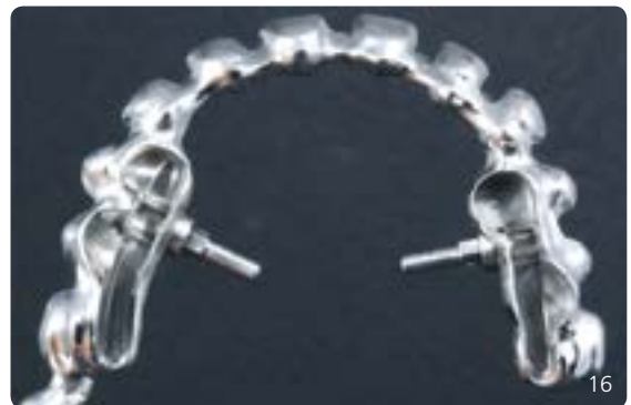
Abb. 15 bis 17 Therapieoption: Industriell gefertigter Steg, der oft als 2.0-Steg bezeichnet wird. Bei dieser Two-in-One-Lösung werden Primär- und Sekundärsteg in einem Stück gefertigt. In diesem Fall wurde der Steg im Oberkiefer in zwei laterale Segmente getrennt und bot somit im Frontzahnbereich sehr gute Möglichkeiten für die ästhetische Gestaltung. Der Halt resultiert aus dem parallelwandigen Stegdesign sowie einer Verbolzung (mk1-Geschiebe).