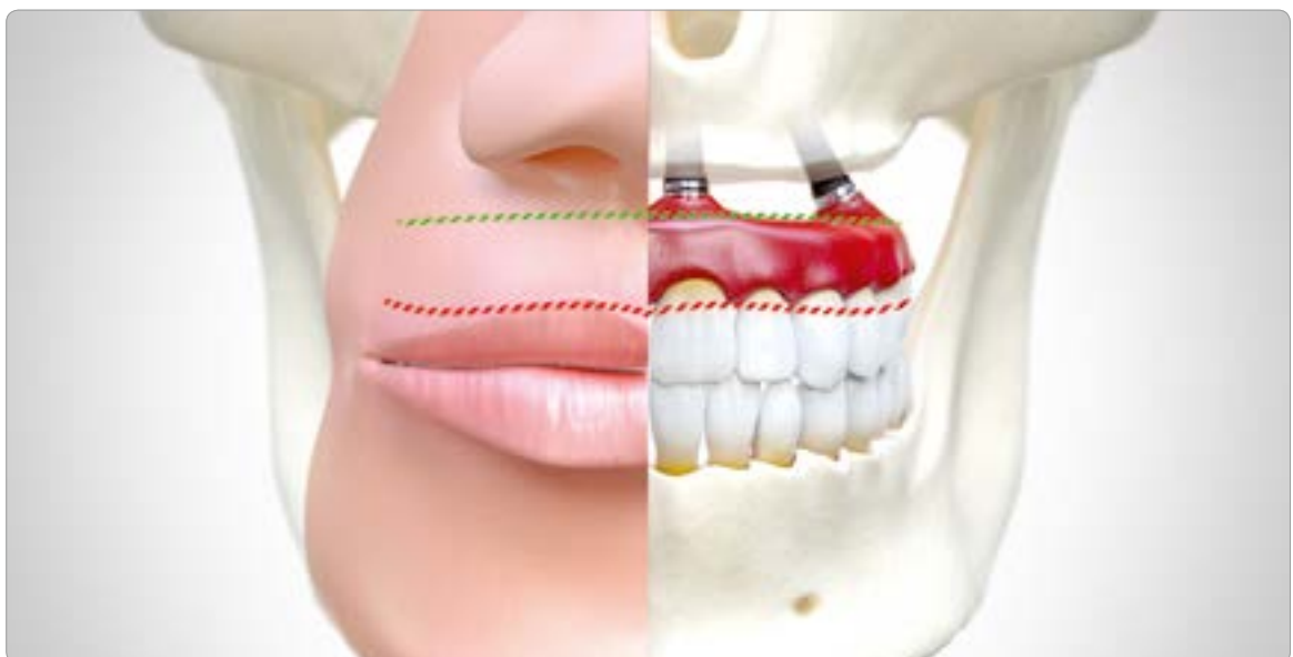
Abb. 11 Bei einem ästhetischen Ergebnis liegt der Übergangsbereich (grün) apikal zur Lachlinie (rot)

nen nehmen wir in der Alterszahnmedizin aus zuvor genannten Gründen immer mehr Abstand. Im unbezahnten Kiefer haben sich bedingt abnehmbare (verschraubt) oder abnehmbare Versorgungen erfolgreich etabliert.