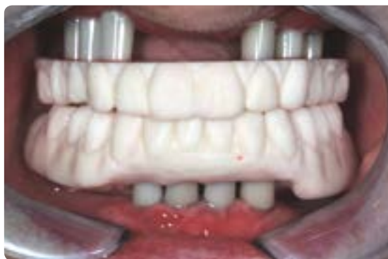
Abb. 29 Finale Bissregistrierung auf den definitiv eingesetzten Primärteilen mit einem Duplikat des Set-ups aus selbsthärtendem Löffelmaterial