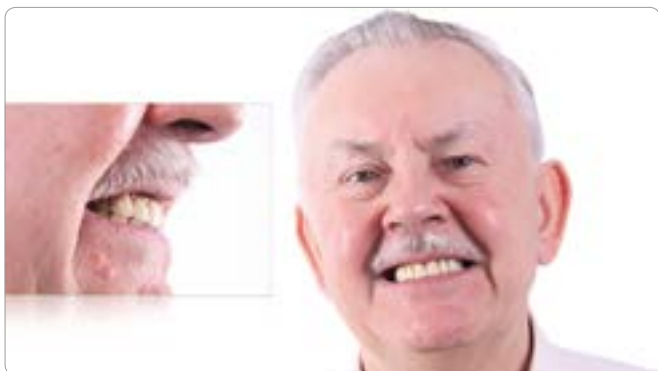
Abb. 1 Viele zahnlose Patienten stehen mitten im Leben. Der funktionsfähige, ästhetische Zahnersatz ist für sie ein Grundbedürfnis. Dieser Patient ist mit Totalprothesen versorgt. Der junggebliebene und aktive Mann fühlte sich unwohl und hatte das Gefühl, dass die Zähne nicht seinem Typus entsprechen