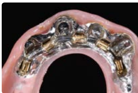
Abb. 18 und 19 Eine derart experimentelle prothetische Verankerung ist unbedingt zu vermeiden. Es ist nicht im Sinne des Patienten und bei den heutigen Möglichkeiten der CAD/CAM-gestützten Fertigung ganz und gar unnötig. Nicht nur die unphysiologische Belastung auf den Implantaten widerspricht jedweder Lehrmeinung, auch die Hygienefähigkeit ist damit nicht gegeben